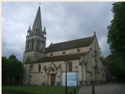
Eglise de Mareil-Marly

apporte un soutien financier important. Mais cette église conserve encore ses secrets : deux magnifiques sculptures en pierre polychrome, datant probablement du XIV e siècle, ont été découvertes en 2017 et réintégreront l'église à la fin de leur remise en état en 2020.