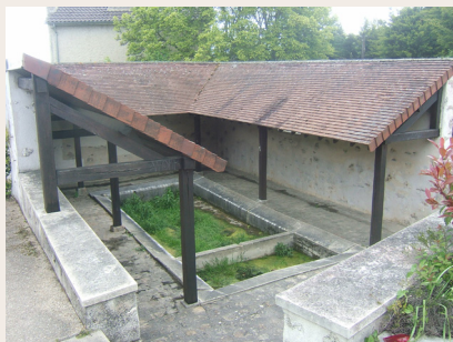
Lavoir de Mareil-Marly