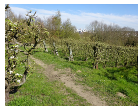
Vergers à Mareil-Marly