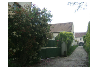
Impasse de la Treille